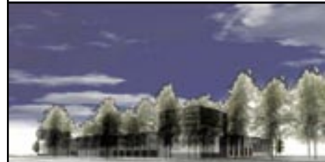
Nordfacade - set fra villakvarterer nord for Roms Hule.