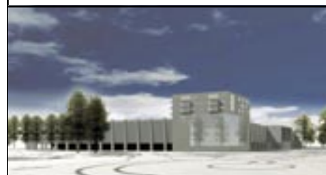
Set mod sydvest fra krydset Stadion Allé-Nørremarksvej.