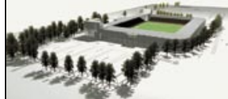
Luftperspektiv set fra sydvest.

I VBE er man ikke i tvivl: de mange "ubekendte" vil blive spottet og løst. Ligningen ender med at gå op. Til glæde for fodbolden, til glæde for Vejle og omegn – og til glæde for musikfolket. Det nye stadion vil nemlig også være velegnet til store musikarrangementer.