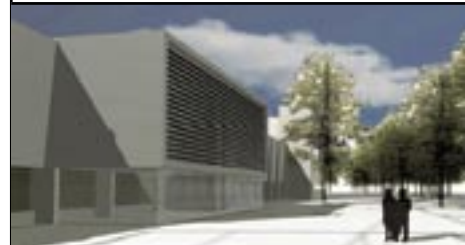
Nordpladsen - Set mod vest hovedindgang og Kong Hans' Eg.